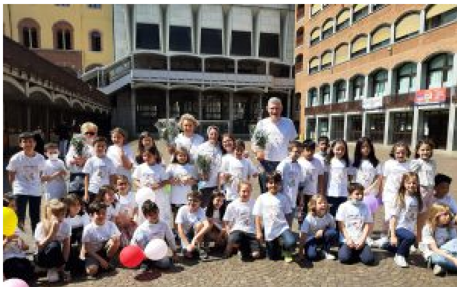
Maggio 2022 – Prima Comunione